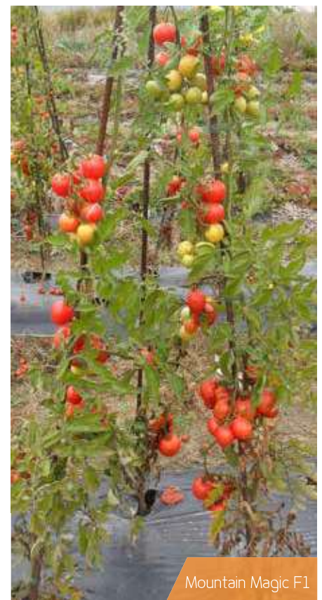
Mountain Magic F1

L'inconvénient de la résistance verticale est que, lorsqu'un cultivar porteur d'un gène de résistance donné est cultivé en présence du pathogène, les souches de mildiou contre lesquelles le gène est efficace sont progressivement remplacées par d'autres souches qui ont la capacité de contourner cette résistance, rendant obsolètes le gène et les cultivars qui le portent. Il est impossible de prévoir combien de temps un gène de résistance va « tenir » face à l'évolution du pathogène. C'est pourquoi les sélectionneurs sont sans cesse à la recherche de nouveaux gènes en prévision du remplacement inévitable de ceux actuellement utilisés.