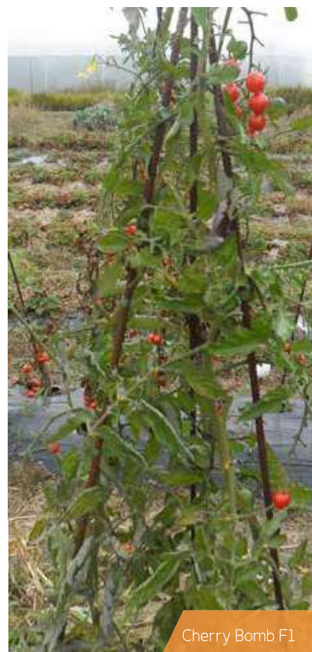
Cherry Bomb F1