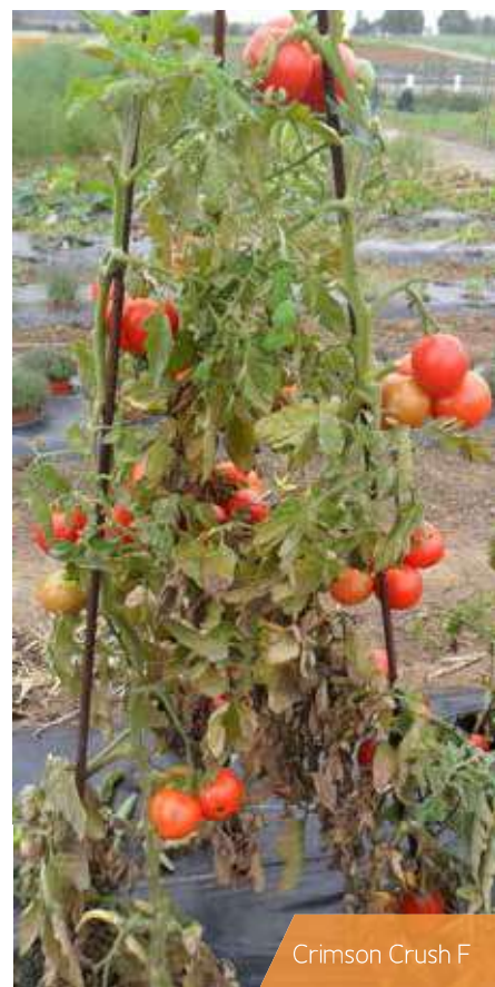
Crimson Crush F